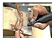
TORRE DEL GRECO